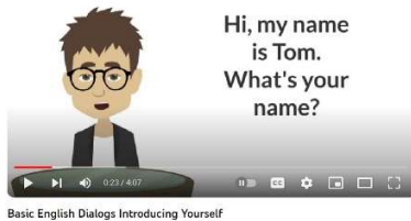
Basic English Dialogs Introducing Yourself