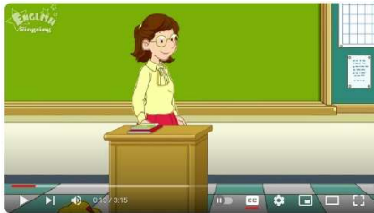
[Greeting] Good morning. How are you? - Easy Dialogue - Role Play

https://youtu.be/xb3za6PAXQE?si=bJwUABFQaRyJkiMW