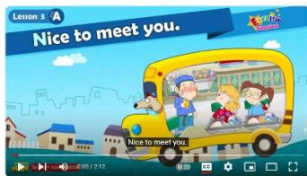
Lesson 3 (A) Nice to meet you. - Greeting - Introducing - Cartoon Story - English Education